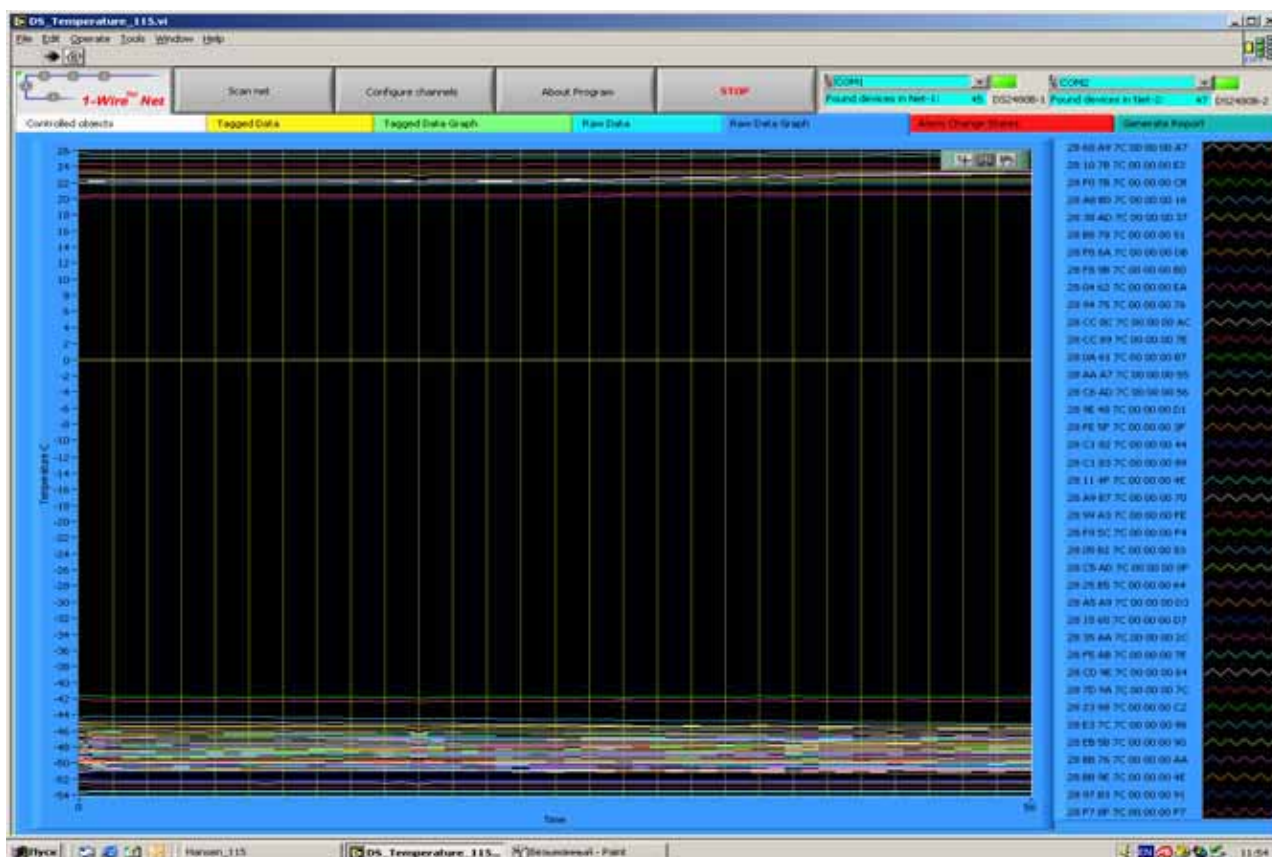
Рис. 6. График изменения измеряемых параметров во времени по всем каналам