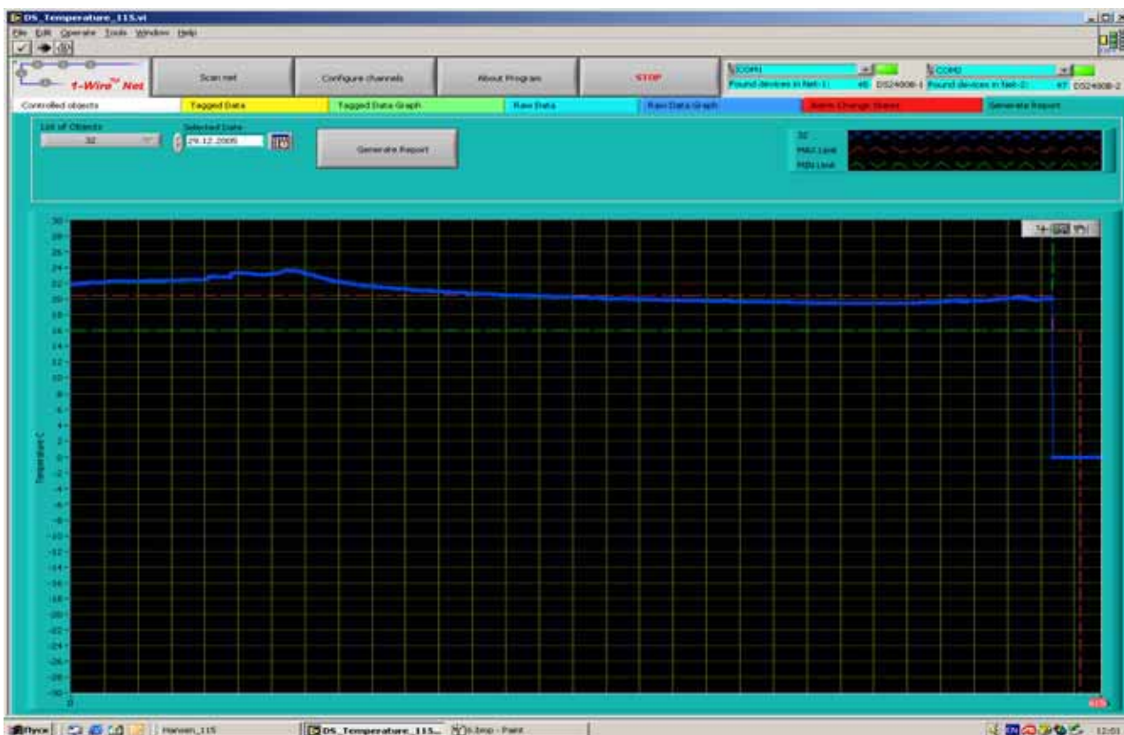
рис.8. График изменения температуры для выбранного канала.

5.9.4. График, рис.8, показывает суточный график изменения температуры для выбранного канала.