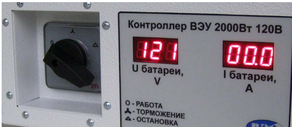
Рис. 2 Расположение органов управления и индикации контроллера