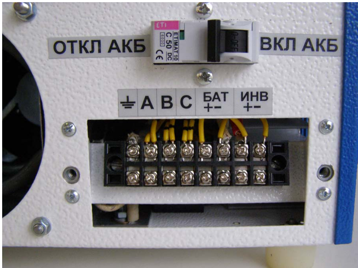
Рис. 3 Расположение клеммника и клемм в клеммном отсеке контроллера

10.5. Подключить кабели от генератора ВЭУ, нагрузку и аккумуляторную батарею к соответствующим клеммам, рис. 3.